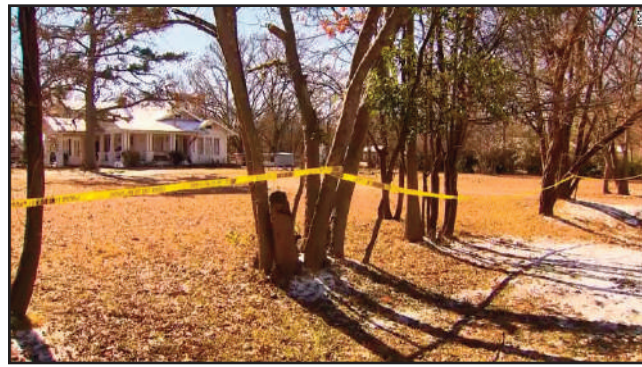
ਵਿਭਾਗ ਵਿਚ ਕੰਮ ਕਰਦਿਆਂ ਘਟੇ ਘੱਟ ਦੀ ਉਲੰਘਣਾ ਕਰਨ ਵਾਲਿਆਂ ਵਿਰੁੱਧ

4 ਲੋਕਾਂ ਦੀ ਜਾਨ ਬਚਾਈ ਸੀ। ਇਥੇ ਜਿਕਰਯੋਗ ਹੈ ਕਿ 31 ਮਈ 2020 ਨੂੰ ਇਕ ਗੈਰਕਾਨੂੰਨੀ ਇਕੱਠ ਤੇ ਕਰਫਿਊ